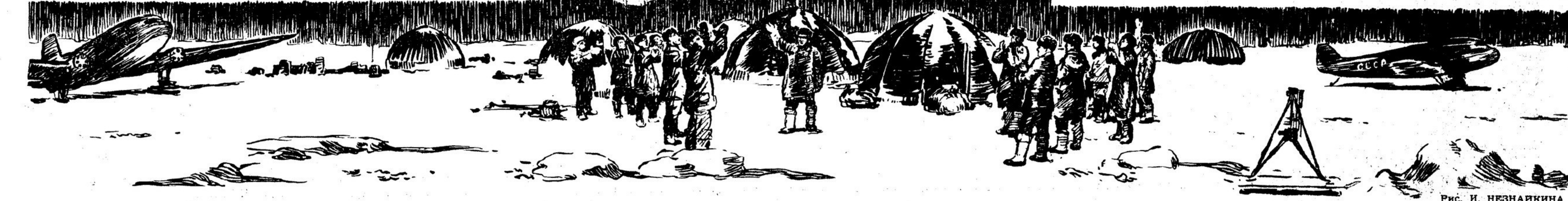
Рис. И. НЕЗНАЙКИНА

Андрей ЖАРКОВ В ПОЛНОЧЬ Словно ласточки крылья, сомкнулись На двенадцати стрелы часов — Всюду двери в домах распахнулись Под ликующий шум голосов. Новый год, словно друга, встречают Сталева, комбайнер и чабан, Всем простором его обнимает Наш любимый, родной Казахстан. Те, кто поднял целинные земли, Жил в палатках, в огне непогод, Чаши полные мыliche подьемлют За счастливый, за Новый год. Он идет по долинам и рекам, По просторам великой земли, Где деревья, одетые снегом, — Будто поднятые хрустали. Миллионы людей с нами вместе Голоса воедино сольют. Раздаются задрывные песни Над страной, как победный салют! Перевел с казахского М. Львов